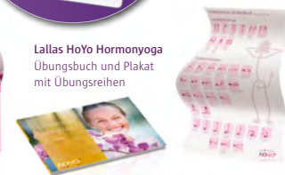
Lallas HoYo Hormonyoga Übungsbuch und Plakat mit Übungsreihen