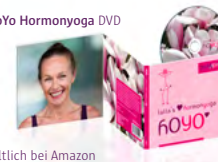
alle erhältlich bei Amazon